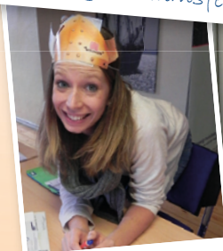
„Könige der Welt“