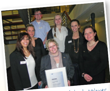
Ausbildungsbetrieb d. Jahres Flensburg, 2012