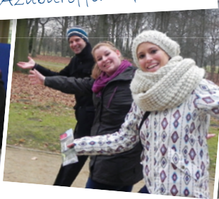
Für jeden Spaß zu haben