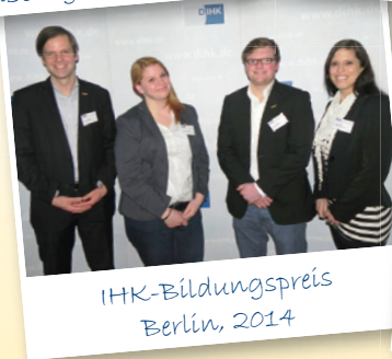
IHK-Bildungspreis Berlin, 2014