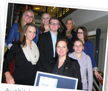
Ausbildungsbetrieb d. Jahres Flensburg, 2013