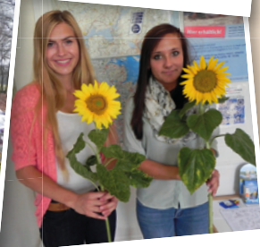
Der 1. Azubitag