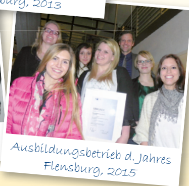
Ausbildungsbetrieb d. Jahres Flensburg, 2015

„In diesem Unternehmen wird jungen Menschen durch vorbildliche Ausbildung ein erfolgreicher Einstieg ins Berufsleben ermöglicht.“