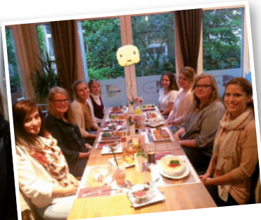
Essen geht immer