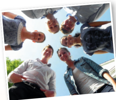
Nicht nur Kollegen